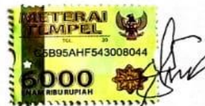
Irmayanti Nurhalizah 050116A036

Ungaran, Juni 2020 Yang Membuat Pernyataan