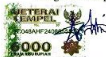
Nuraini Fitriyah Marwa