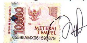
Ita Desi Saputri