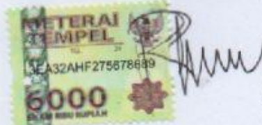
Nurma Septi Irani

Ungaran, Februari 2020 Yang membuat pernyataan