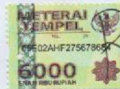
Nurma Septi Irani