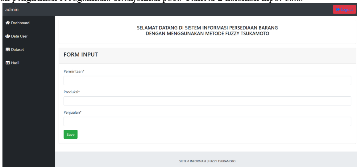
Gambar 2 halaman input data

Gambar di atas menampilkan antarmuka halaman login, yang merupakan titik akses utama bagi administrator sistem E-Stock Bayou Indonesia. Pada halaman ini, pengguna diminta untuk memasukkan kredensial berupa nama pengguna dan kata sandi untuk dapat masuk ke dalam sistem. Tampilan yang bersih dan fokus pada input kredensial mengindikasikan bahwa halaman ini didesain untuk memfasilitasi akses masuk yang aman dan terkontrol ke dalam aplikasi manajemen persediaan. Setelah berhasil login, pengguna dapat masuk ke halaman input data, yang formatnya dirancang untuk memudahkan pemasukan data permintaan, stok, dan pengiriman sebagaimana ditunjukkan pada Gambar 2 halaman input data.