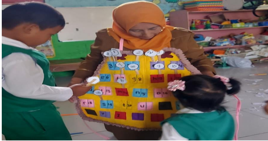
Gambar2 Foto stik angka dan huruf