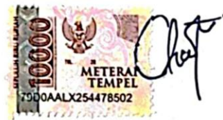
Chandra Rosalya Dju

Ungaran, 16 Agustus 2024 yang membuat pernyataan