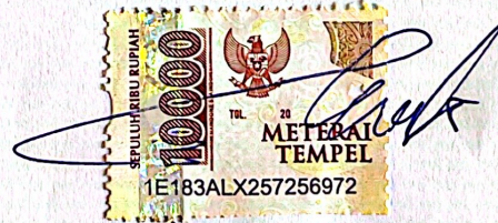
Nikita Febiana Putri

Ungaran, 24 Januari 2024 Yang membuat pernyataan,