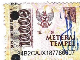
Dewi Chofifah Prastiwi