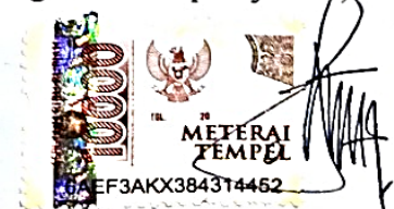
Afifah Styah Ningrum