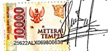
Hayyu Puspita Dewi