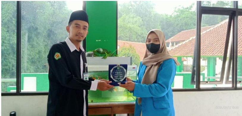
Penyerahan plakat kepada Kepala Sekolah SMK Ezzul Moslem sebagai ucapan terimakasih karena sudah memberikan izin, arahan, bimbingan dan sebagai fasilitator dalam penelitian di SMK Ezzul Moslem