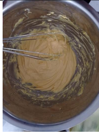
Gambar 2. Penghalusan telur, mentega