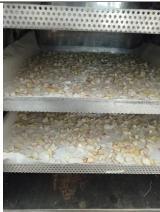
Gambar 3. Pengeringan dengan menggunakan cabinet dryer selama 5-6 jam suhu 75°