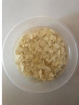
Gambar 2. Perendaman air garam 30 menit