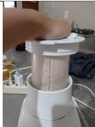
Gambar 4. penghalusan