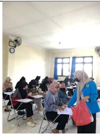
Gambar 6. Uji mutu hedonik pada panelis