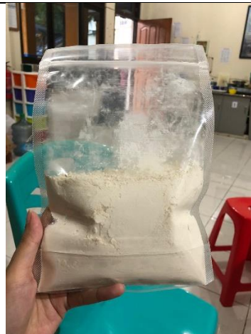
Gambar 6. Tepung biji nangka