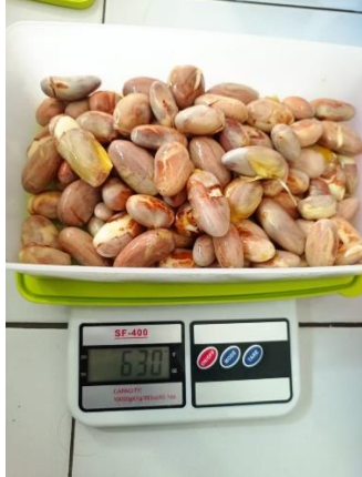
Gambar 1. Biji nangka