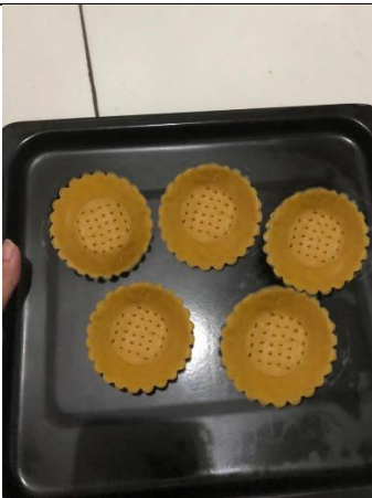
Gambar 5. Pie formula 2 (100% biji nangka)