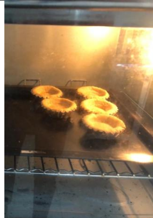
Gambar 4. Pemanggaan pie setelah di cetak 130° C 20-30 menit