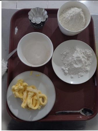
Gambar 1. Bahan-bahan pie