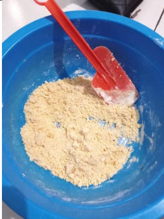
Gambar 3. Pencampuran semua bahan