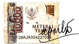
Isna Aprillia NIM. 060118A030

Ungaran, 5 Januari 2024 Yang Membuat Pernyataan