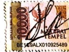
Budi Rusmanto 050118A029