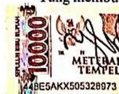
Afrida Ridantika Zaharni