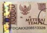
Vivit Choirul Nisya