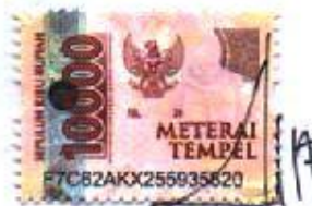
Fitri Nuraeni K.D