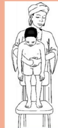
hemlich manoevre pada anak yang lebih besar