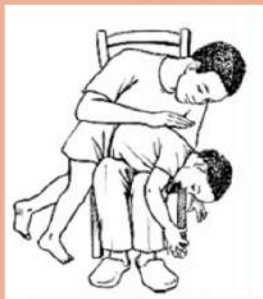
hemlich manoevre pada anak