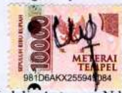
Medelin Antonece Ndapamuri 050118A105