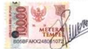
Tegar Zulfa A.K

Semarang, 29 Januari 2023 Yang membuat pernyataan