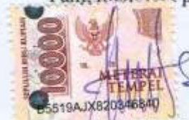
Isnabela Wahyu Utami NIM: 020118A066

Ungaran, 17 Agustus 2022 Yang membuat pernyataan,