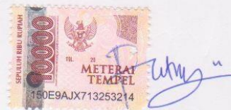
Putri Intan Lestari

Ungaran, 7 Maret 2022 Yang membuat pernyataan,