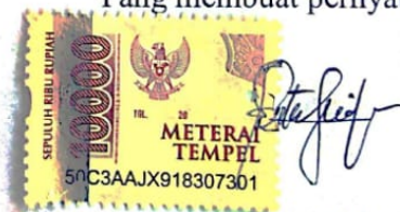
Putu Putri Septina Widyadewi

Ungaran, 3 Agustus 2022 Yang membuat pernyataan