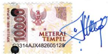
Eva Duwi Ratnaningrum

Ungaran, 4 Februari 2022 Yang Membuat Pernyataan