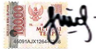
Beti Wulan Larassati NIM 080118A012