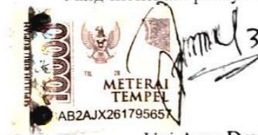
Uci Asna Devia

Semarang, 03 Januari 2022 Yang membuat pernyataan,