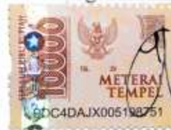
Bagas Agil Ariyanto 080117A008

Ungaran, 9 Juni 2021 Yang membuat pernyataan