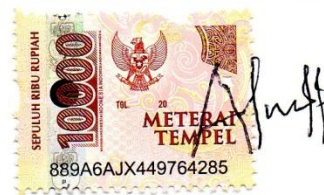
Tina Setyaningsih 080117A061