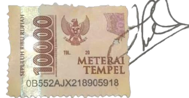
(Nur Huda Setiyawan)