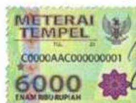
(Afifah Nur Hawa)