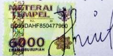
Fitri Rahayu Lestari NIM.050117A043

Ungaran, Februari 2021 Yang membuat pernyataan