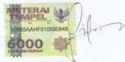
Ahmad Nur Faisal NIM. 080117A002