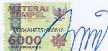
Eza Nagita Pramudita